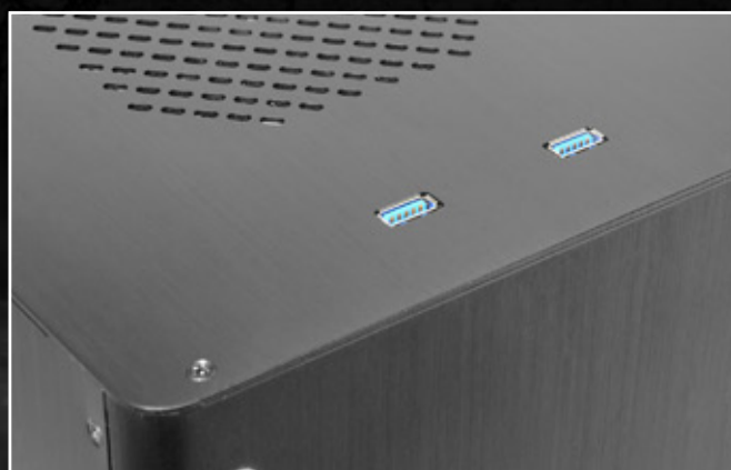
2 個 USB3.0 (19-pin 內接)