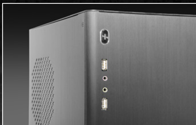
前置 I/O: 2 個 USB2.0, 2 個音頻孔