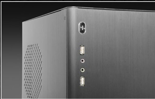
Front-I/O: 2x USB2.0, 2x Audio