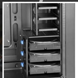
Einfache SSD- und Festplattenmontage