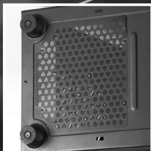
Staubfilter im Gehäuseboden