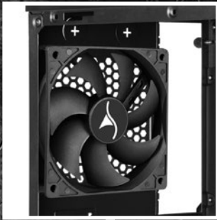
120-mm-Lüfter in Gehäuserückseite