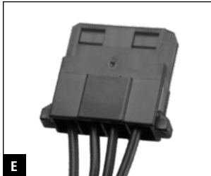
E Max. 1000 mm (500 W) Max. 880 mm (600 W, 700 W)