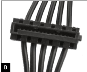
D 550 mm + 150 mm + 150 mm