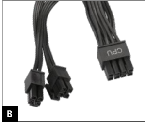
B 600 mm + 150 mm