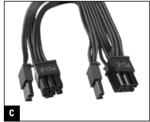
C 550 mm + 150 mm