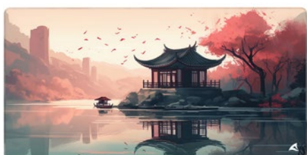
SKILLER SGP40 D7