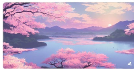
SKILLER SGP40 D3