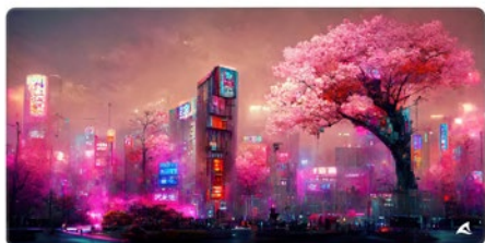
SKILLER SGP40 D4