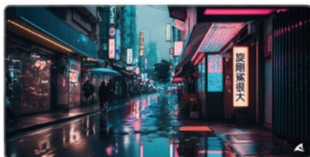
SKILLER SGP40 D5