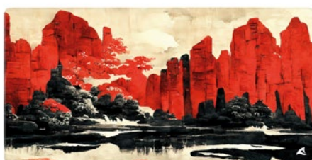
SKILLER SGP40 D11