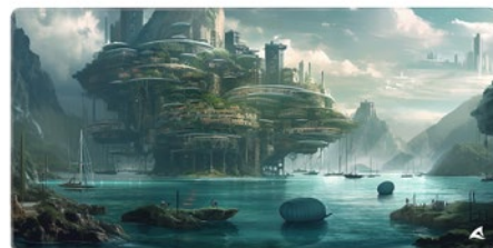
SKILLER SGP40 D6