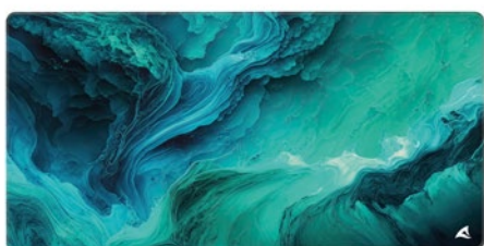
SKILLER SGP40 D10