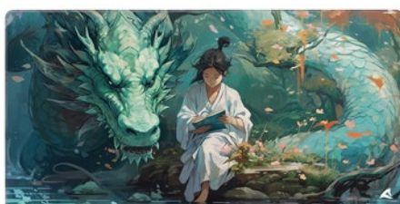
SKILLER SGP40 D8