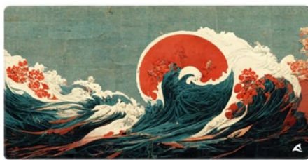
SKILLER SGP40 D2